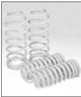
HILUX 185 SURF 2inchDOWN