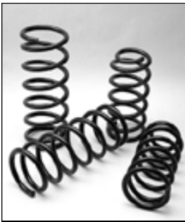
SAFARI Y60 2inchUP