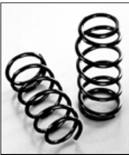
HILUX 130 SURF 2inchUP