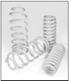
LAND CRUISER 95 PRADO 2inchDOWN